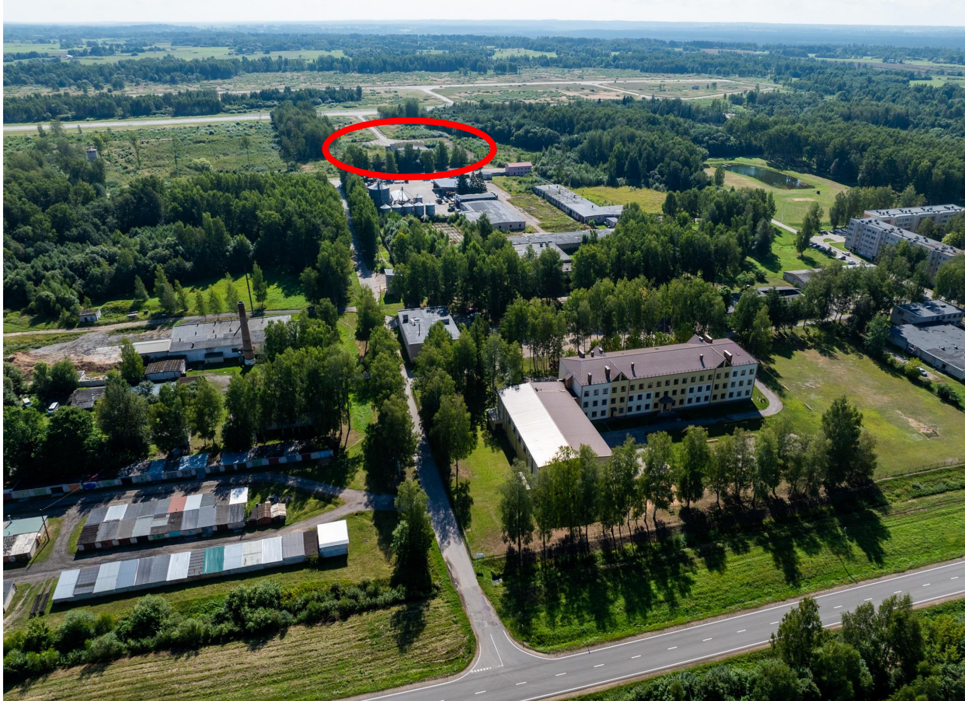
A 13 šoseja, Daugavpils - Rēzekne